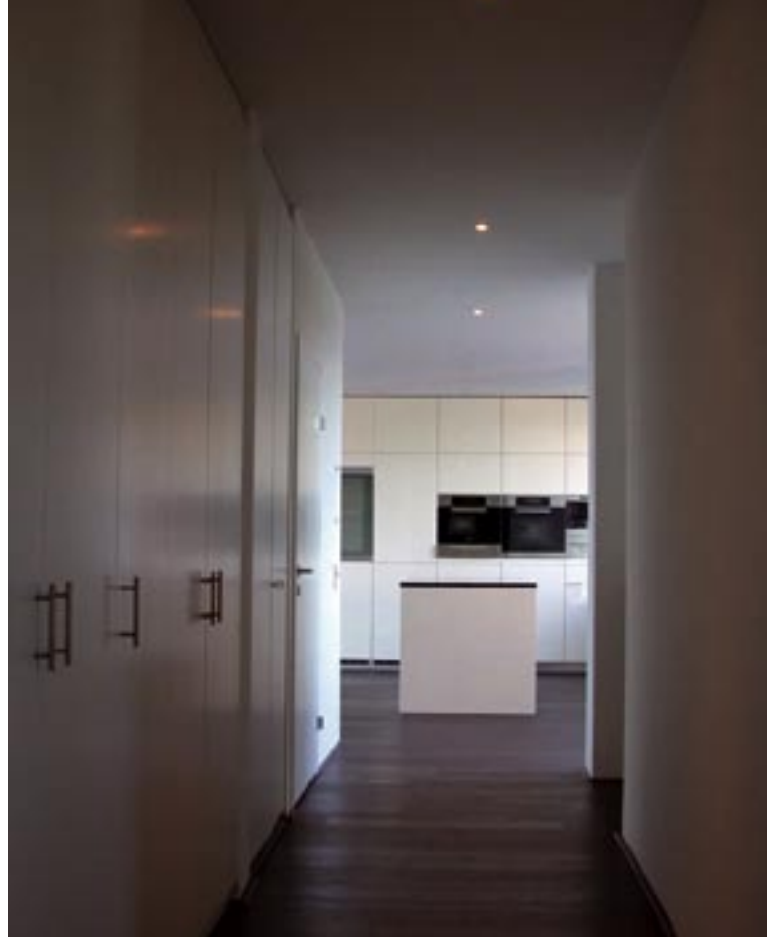
CONTRASTES Ao vermelho-escuro das paredes das áreas comuns e das escadas, contrapõem-se os tectos brancos e o piso negro. Nos quartos prevalecem o branco e a madeira. Ao fundo (à direita), a cozinha em tons brancos, torna o equipamento quase imperceptível.

piso, uma luz exclusiva, consoante a iluminação exterior. Amplos planos de vidro permitem estabelecer uma continuidade entre janelas de diferentes divisões.