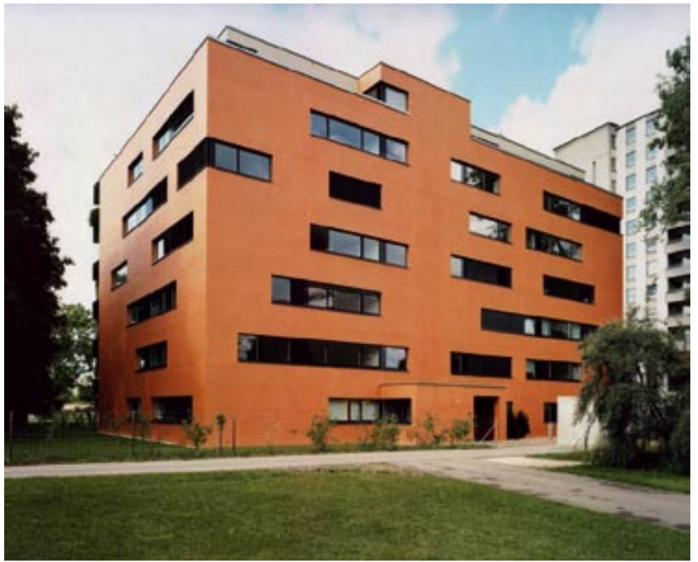
LUMINOSO Amplios planos de vidro possibilitam, a cada piso, uma luz peculiar, consoante a iluminação exterior.